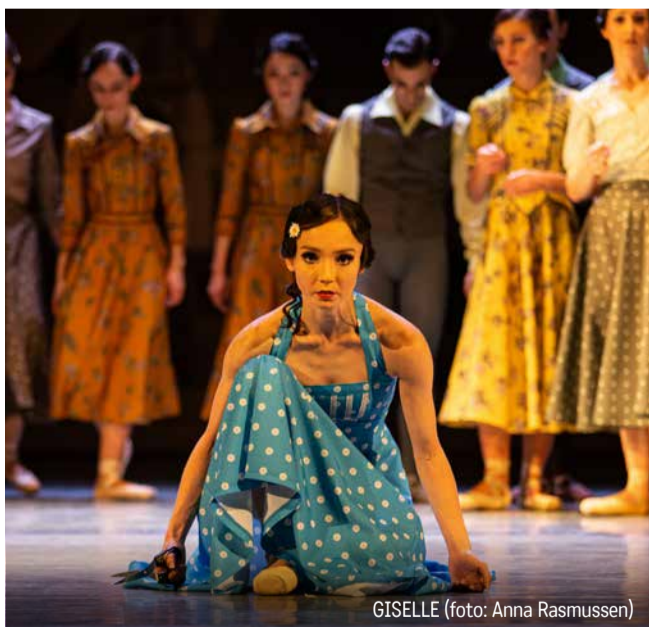
GISELLE (foto: Anna Rasmussen)