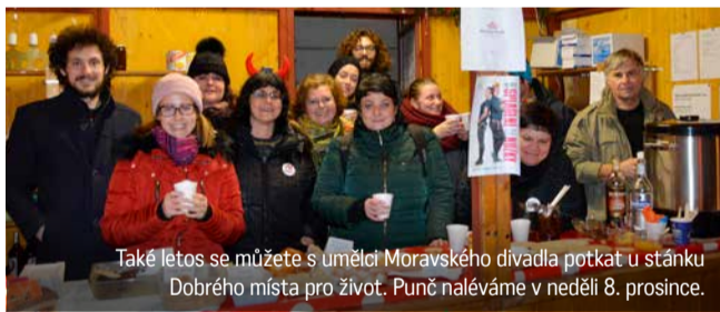
Také letos se můžete s umělci Moravského divadla potkat u stánku Dobrého místa pro život. Punč naléváme v neděli 8. prosince.

V prosinci chystá Moravské divadlo Olomouc tradičně pestrý předvánoční program pro malé i velké návštěvníky. Do divadelní budovy na Horním náměstí opět zavítá Mikuláš, aby společně s dětmi rozsvítil vánoční stromek. Vedle pohádkových představení Louskáček a Královna Koloběžka První nabízí prosincový program také tradiční koncertní provedení Rybovy České mše vánoční či kolekci nejkrásnějších vánočních koledí v podání sboru opery a operety Moravského divadla. Navíc se můžete s herci Moravského divadla setkat u stánku s punčem a přispět na dobrou věc.