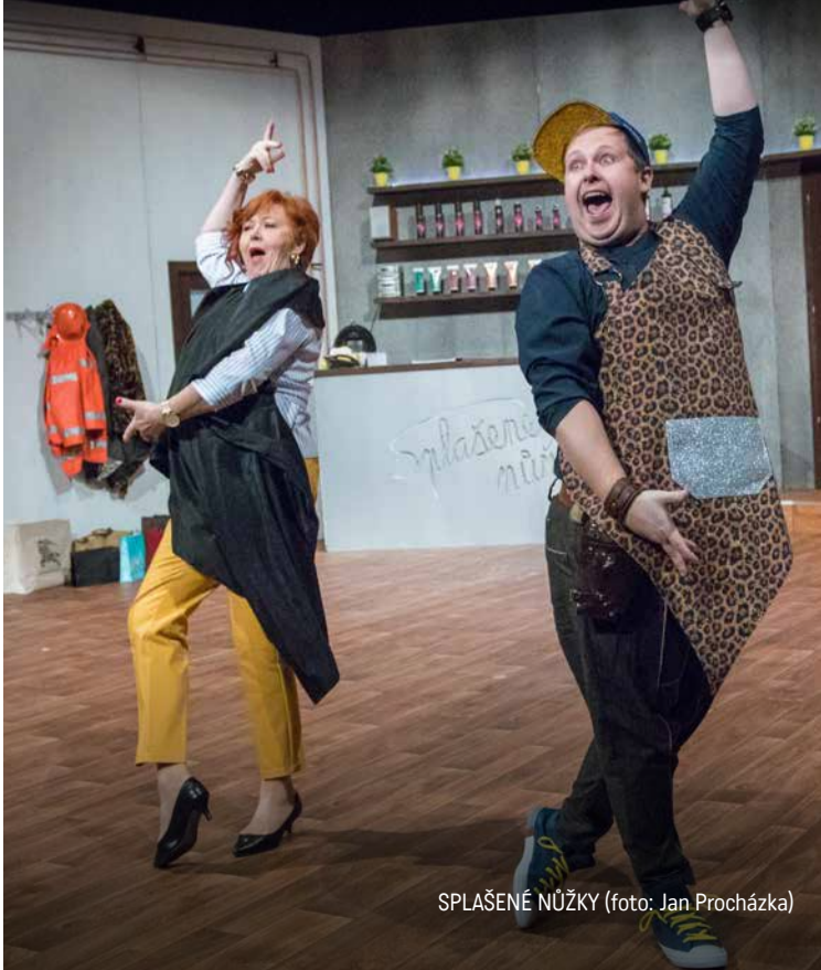
SPLAŠENÉ NŮŽKY