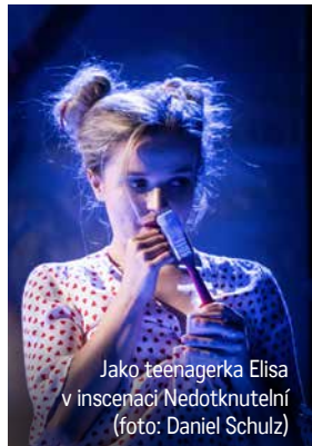
Jako teenagerka Elisa v inscenaci Nedotknutelní