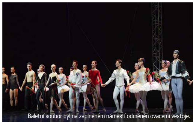
Baletní soubor byl na zaplněném náměstí odměněn ovacemi vestoje.