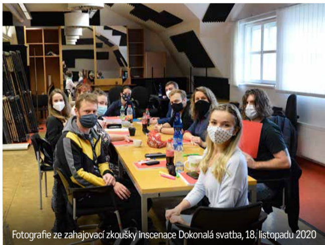
Fotografie ze zahajovací zkoušky inscenace Dokonalá svatba, 18. listopadu 2020

Adaptace románu bratří Mrštíků Rok na vsi vznikne v režii Janky Ryšánek Schmiedtové. Premiéra je přesunuta na 21. ledna 2022.